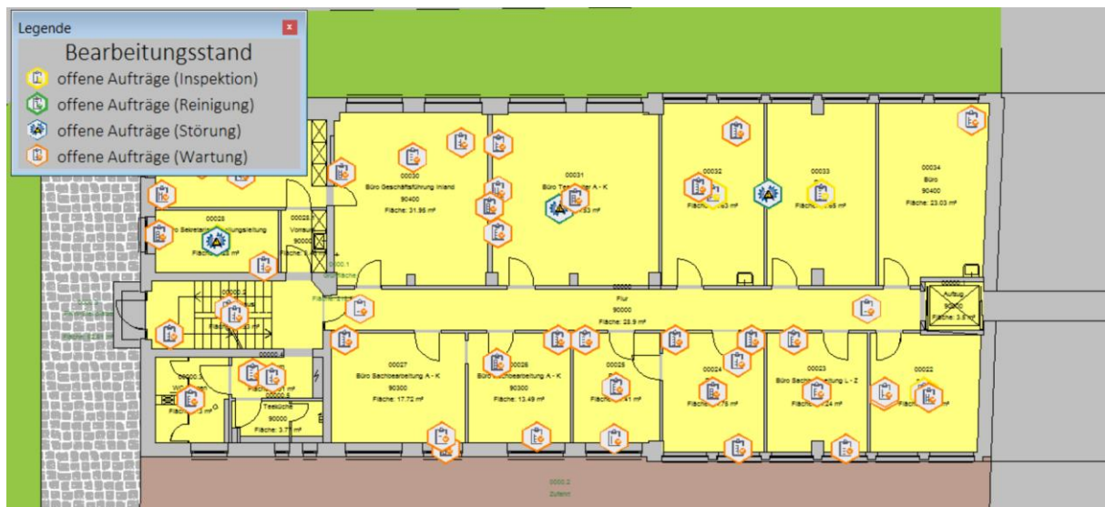
Visualisierung von Aufträgen mit Bearbeitungsstand im CAD-Plan