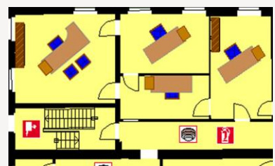
Mobiliar im CAD-Plan

Prüfpflichtige Anlagen, Maschinen und andere Objekte des Inventarbuches werden im CAD-Plan veranschaulicht.